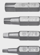
Puntas y Brocas